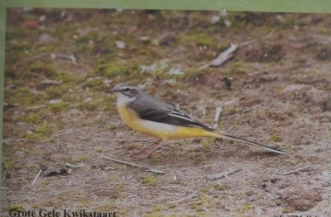
Grote Gele Kwikstaart